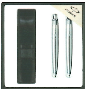
Długopis i ołówek

Zestaw Parker Jotter Special Czarny CT Długopis i Ołówek z Etui Pagani. Ołówek czarnych dostępnych jest tylko ok 400 szt (więcej tych modeli już nie będzie). Proponuję ten sam model w ilości 1700 kpl ale cały stalowy CT długopis + ołówek w pudełku upominkowym + etui marki Pagani. Czy zamawiający akceptuje taką zamianę?