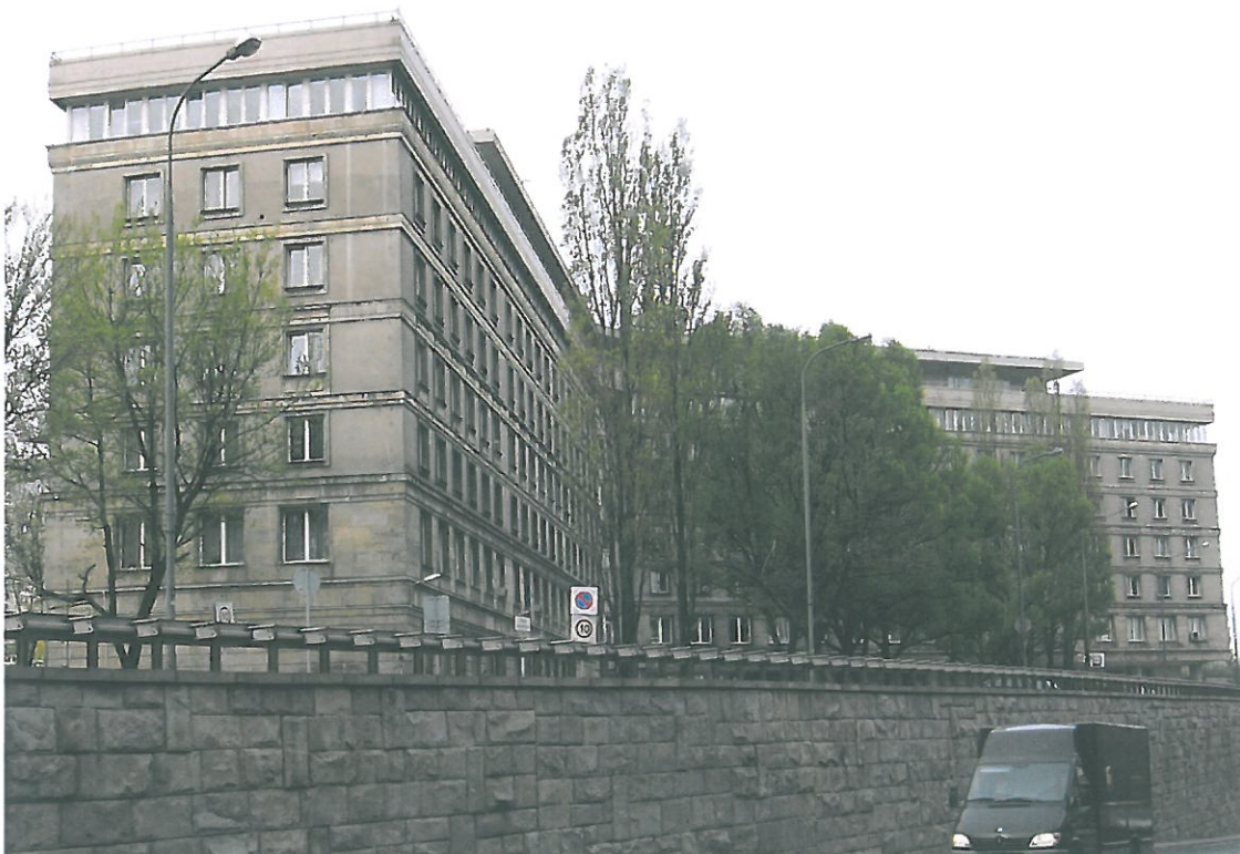
Fot. 1 Widok ogólny gmachu GUS od strony Trasy Łazienkowskiej