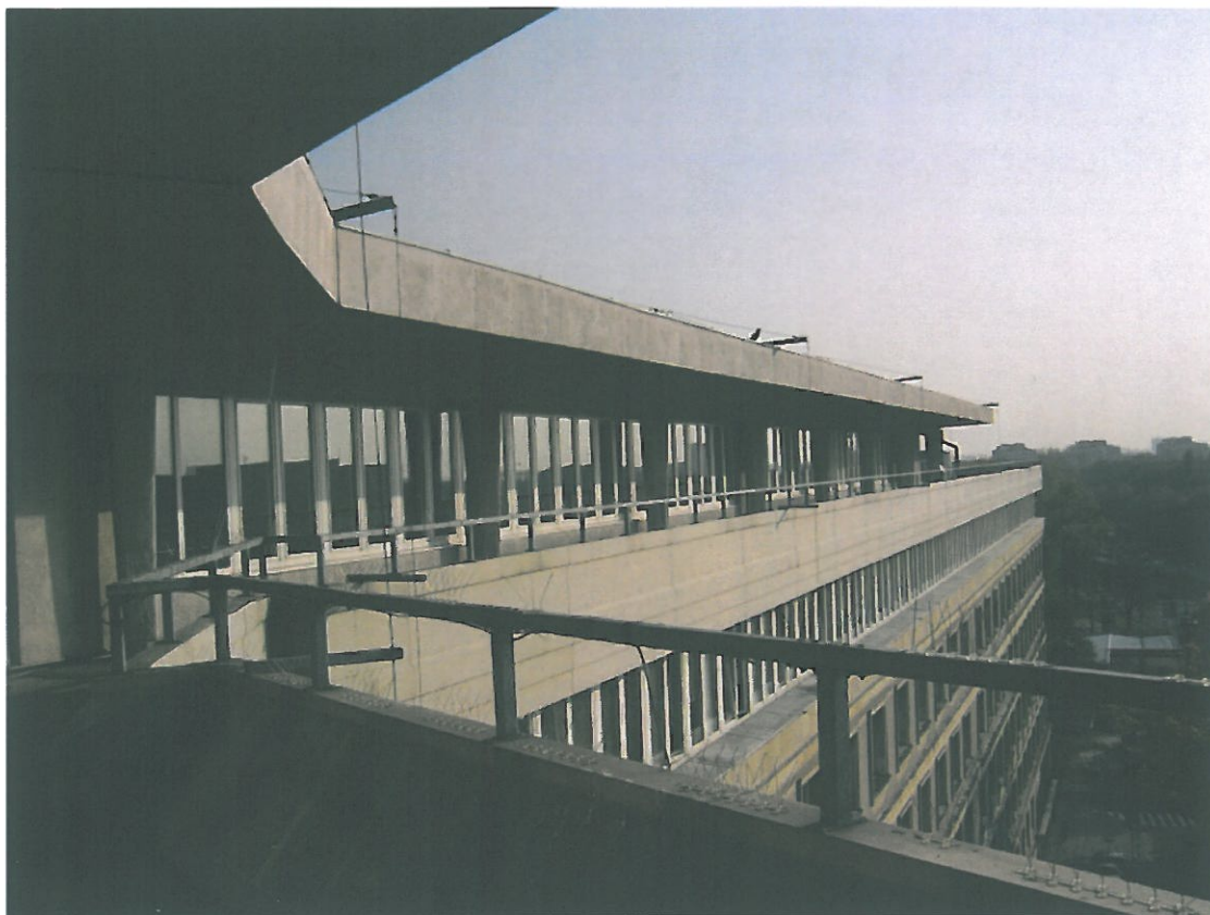
Fot. 4 Taras na VII piętrze

Inwestor : GŁÓWNY URZĄD STATYSTYCZNY Al. Niepodległości 208, 00-240 Warszawa