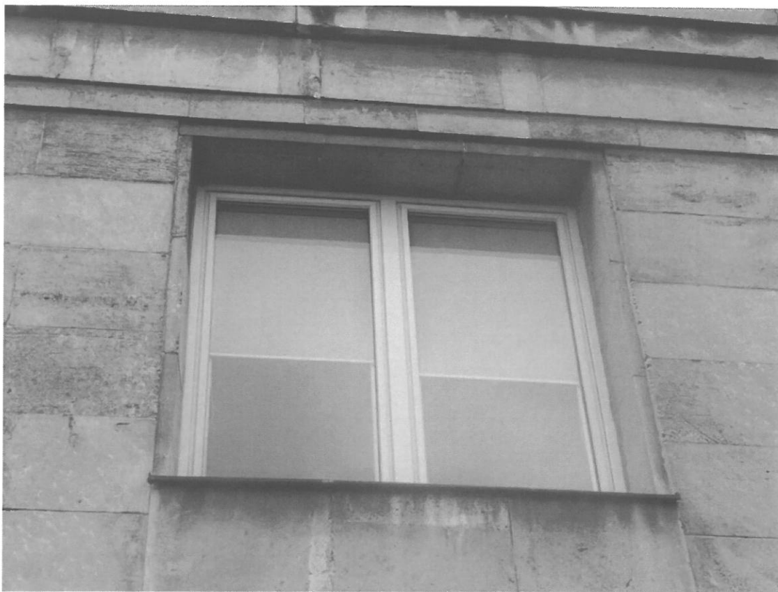
Fot. 6 Fragment elewacji kamiennej

Inwestor: GŁÓWNY URZĄD STATYSTYCZNY Al. Niepodległości 208, 00-240 Warszawa