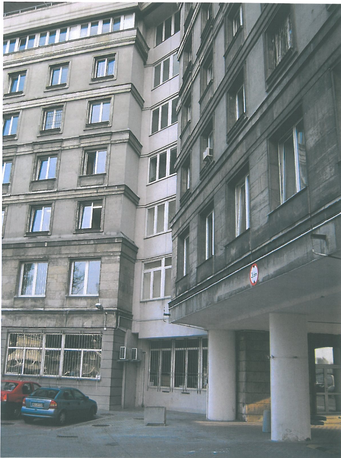
Fot. 3 Fragment elewacji na styku skrzydeł

Inwestor : GŁÓWNY URZĄD STATYSTYCZNY Al. Niepodległości 208, 00-240 Warszawa