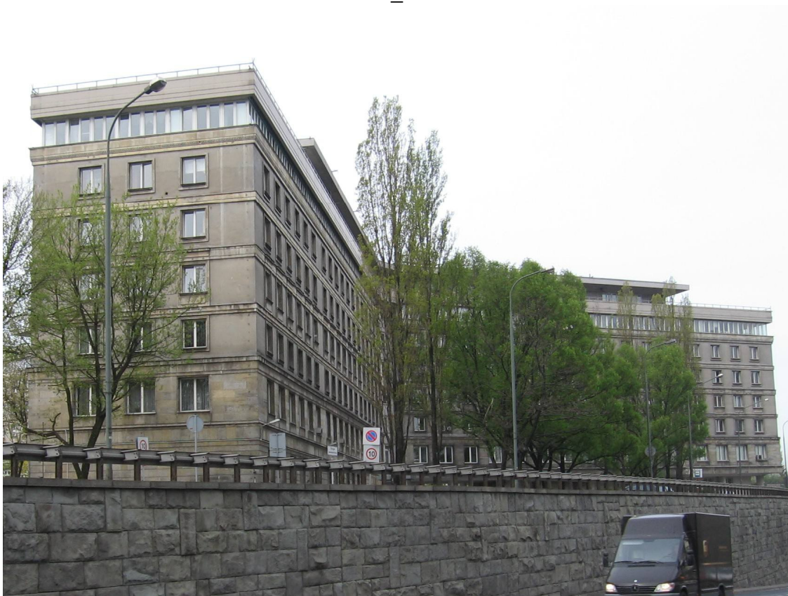
Fot. 1 Widok ogólny gmachu GUS od strony Trasy Łazienkowskiej