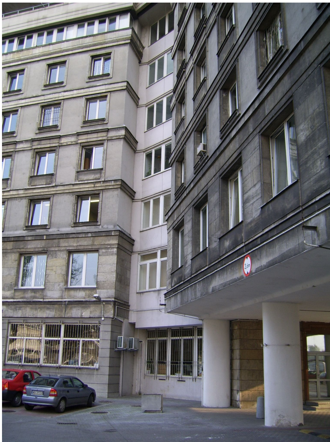
Fot. 3 Fragment elewacji na styku skrzydeł

Inwestor : GŁÓWNY URZĄD STATYSTYCZNY Al. Niepodległości 208, 00-240 Warszawa