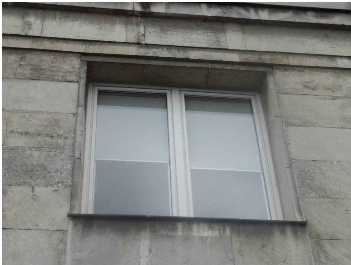
Fot. 6 Fragment elewacji kamiennej

Inwestor : GŁÓWNY URZĄD STATYSTYCZNY Al. Niepodległości 208, 00-240 Warszawa