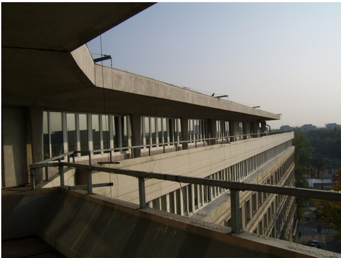
Fot. 4 Taras na VII piętrze